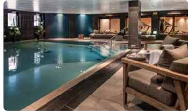
SPA MANALI HÔTEL MANALI LODGE 5*