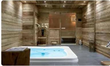
SPA LE C RESORT LE C 4*